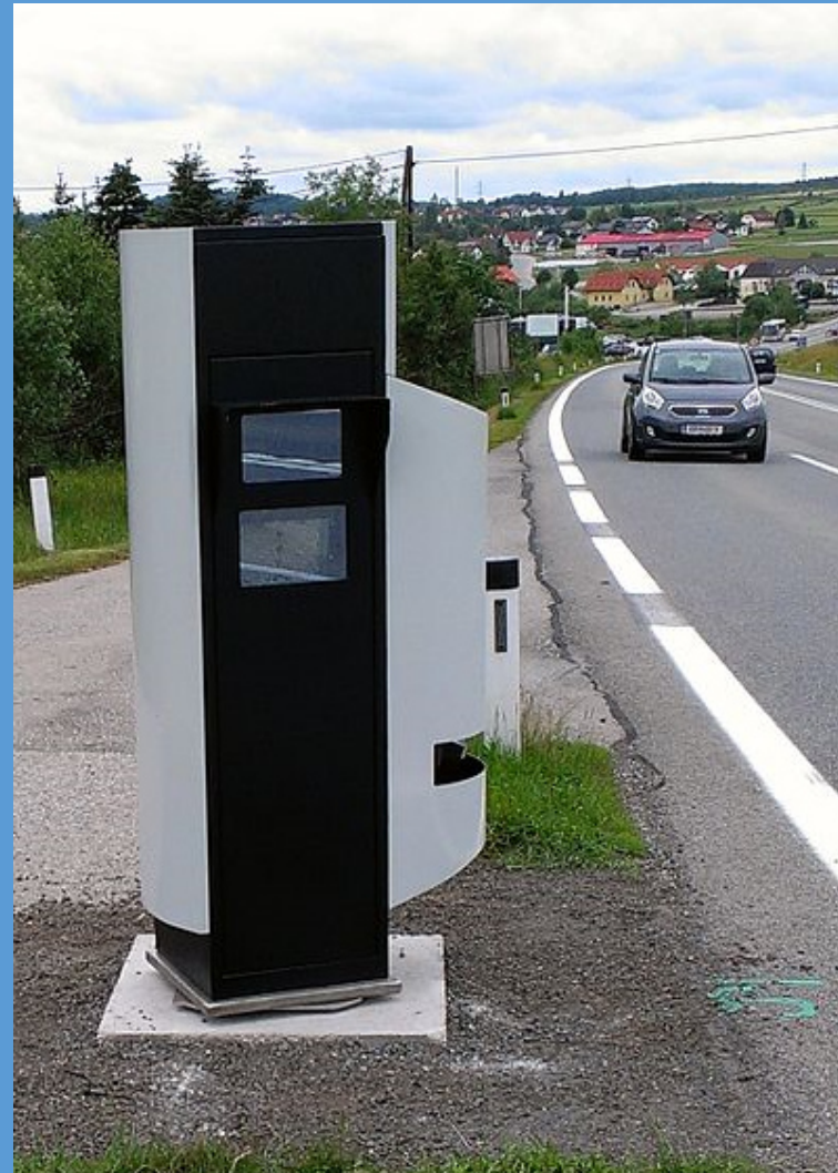
Kennzeichenerfassungsgerät am Kontrollpunkt